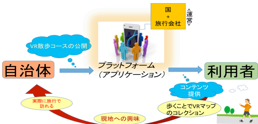
<図1 アプリケーションのシステム図>