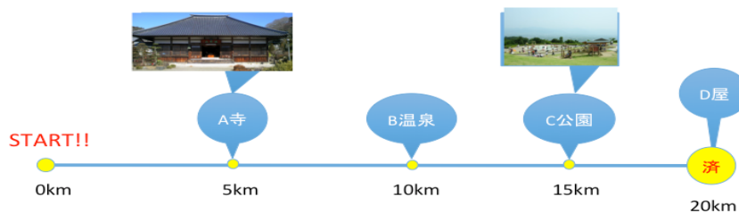
<図2 コースイメージ図>